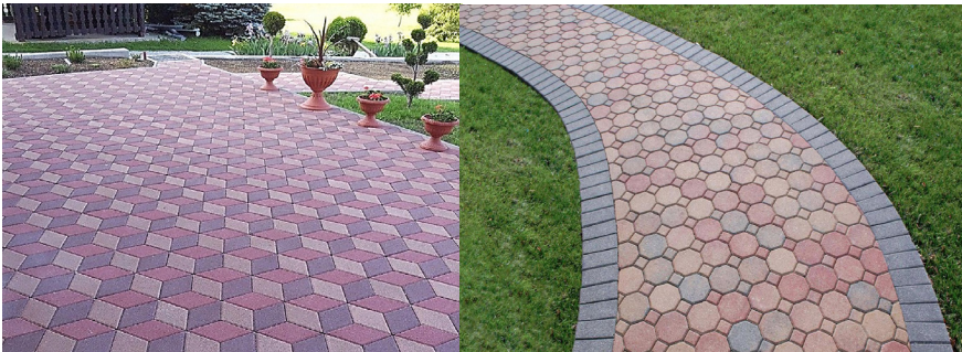
Gambar 1.3 Contoh pengubinan dengan dengan satu dan lebih jenis ubin (sumber: Google Image)

Dengan menggunakan konsep konfigurasi integrasi paving block , permasalahan tersebut dapat diatasi secara signifikan. Konsep ini memungkinkan bangun-bangun datar yang dipasang tidak hanya sejenis, tetapi dapat lebih dari satu jenis. Sebagaimana diilustrasikan pada gambar 1.3, integrasi berbagai bentuk geometris: segi empat, segi enam, atau bentuk lainnya, dalam satu kesatuan pola menciptakan fleksibilitas yang lebih besar dalam menutup bidang.