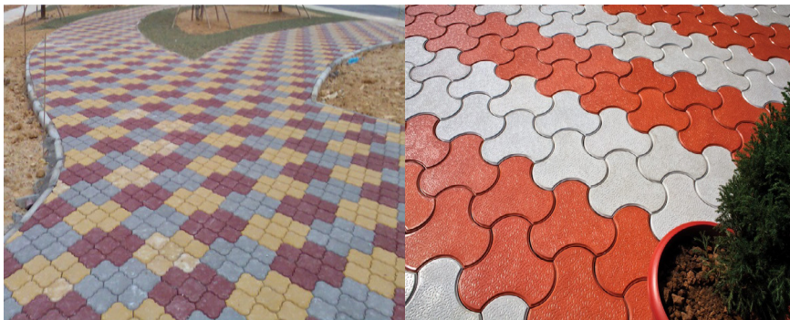
Gambar 1.1 Contoh pengubinan paving block halaman rumah

Saat ini pemasangan paving block dikerjakan secara manual, termasuk juga dengan desain konfigurasi pemasangan dilakukan secara manual. Belum menggunakan pemrograman komputer dalam proses pra-integrasi pemasangan paving block , sehingga variasinya terlihat cenderung monoton, sebagaimana terlihat pada Gambar 1.2.