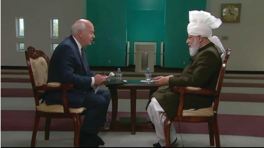
Gambar 1.3. Wawancara

sangat tepat untuk mengetahui atau menilai kepribadian seseorang. Interview yang dilakukan secara tertutup, mendalam, atau pribadi akan membantu untuk melihat dan mengetahui secara jelas dan mudah karakter, kepribadian, tingkah laku, atau mental seseorang.