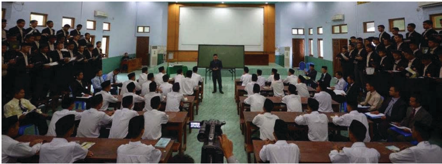
Gambar 1.2. Observasi proses belajar di kelas

melakukan observasi dalam laboratorium sedangkan ilmu sosial bisa berada dalam laboratorium ataupun di luar laboratorium. Misalnya melakukan observasi cara mengajar guru di dalam kelas atau observasi perilaku penjual dan pembeli di pasar. Tekniknya pun beragam, ada yang diketahui oleh subjek observasi dan ada yang tidak tampak.